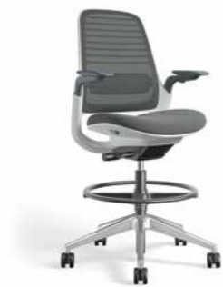
Altura delineante Mecanismo activado por peso