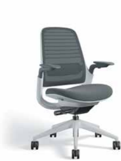
Altura estándar Mecanismo activado por peso